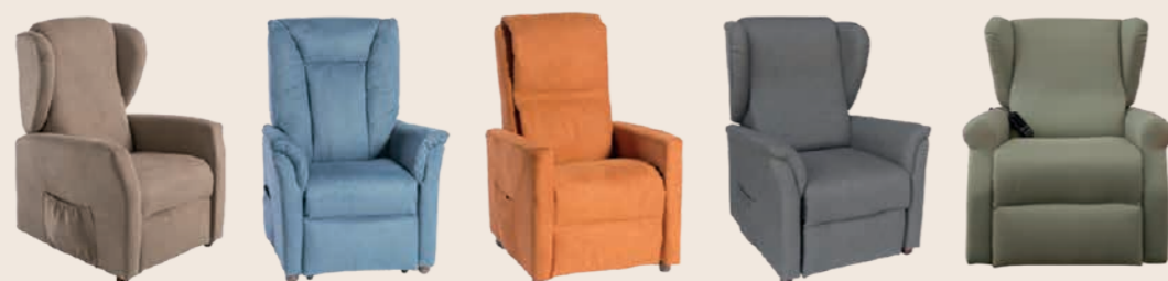
Poltrone Relax con alzapersona

Grande disponibilità al pronto presso i nostri spacci